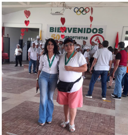
Pereira y Armenia