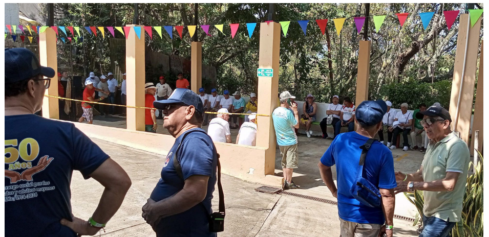
Jugadores de Tejo