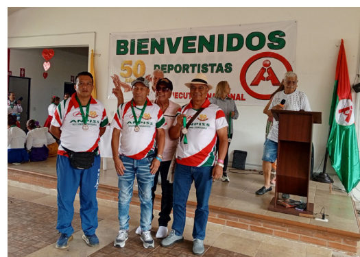
Fusagasugá Tercer puesto