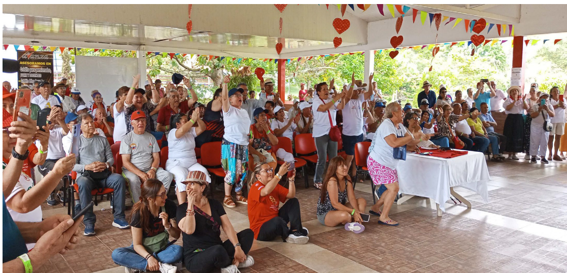
Presentación de Danzas