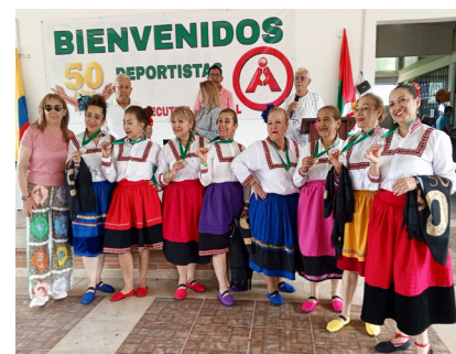
Bogotá Tercer puesto