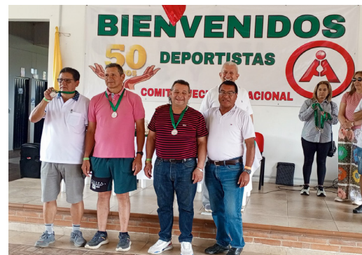
Soacha Tercer puesto