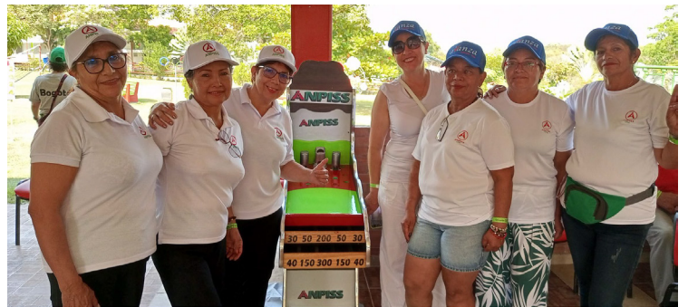
Soacha y Chia