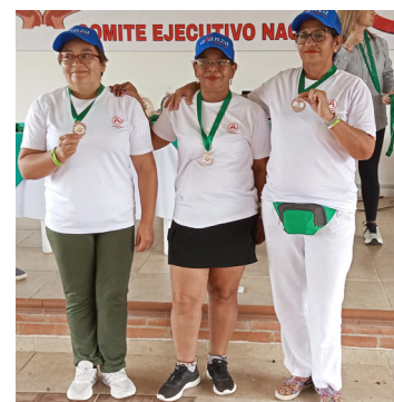
Chia Tercer puesto