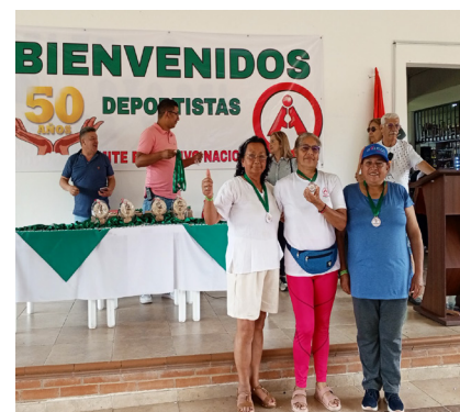
Chia Tercer puesto