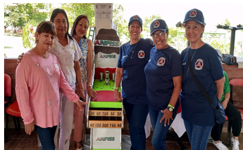
Espinal, Florencia y Cúcuta