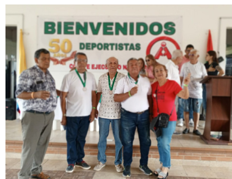
Ibagué Tercer puesto