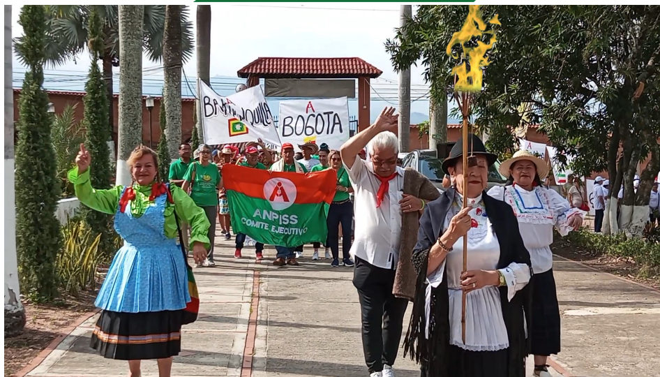
APERTURA JUEGOS, porta la ANTORCHA OLIMPICA la presidente de DUITAMA acompañada de los delegados de su seccional.